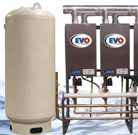
Rack Pack™ en paquete de seis unidades Entrada de 1 890 000 BTU como máximo