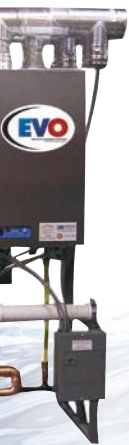
de Hamilton se muestra